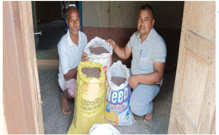
सरसों मिनिकिट प्रत्यक्षण का फोटो, प्रखण्ड - पालोजोरी