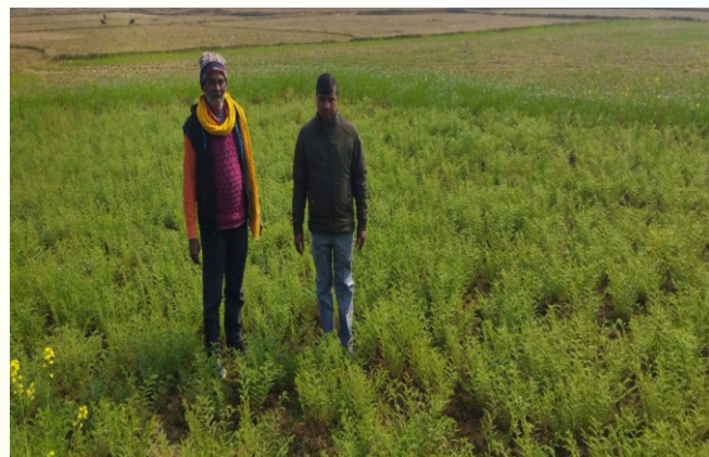
चना प्रत्यक्षण का फोटो, प्रखण्ड - देवीपुर