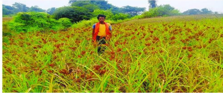
मडुवा मिनिकिट प्रत्यक्षण का फोटे , ग्राम- महादेवअम्बा, पंचायत- दोंदिया, प्रखण्ड- सोनारायठढ़ी