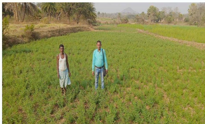
चना प्रत्यक्षण का फोटो, प्रखण्ड - सोनारायठाड़ी