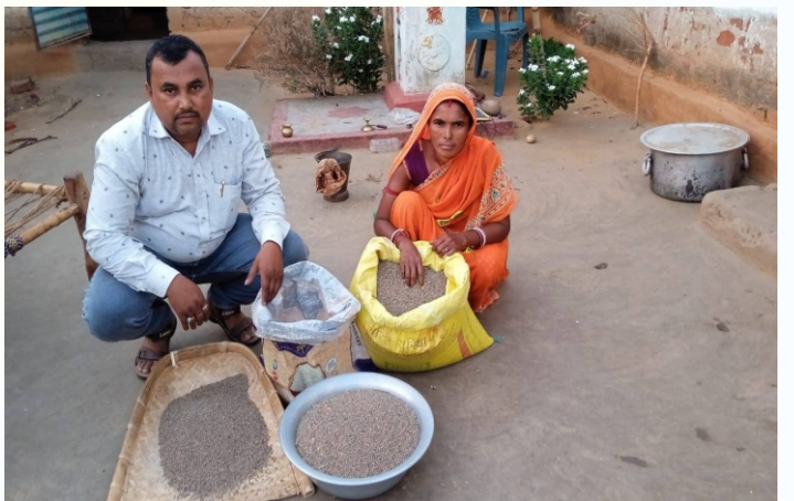
मसूर प्रत्यक्षण का फोटो, प्रखण्ड - पालोजोरी