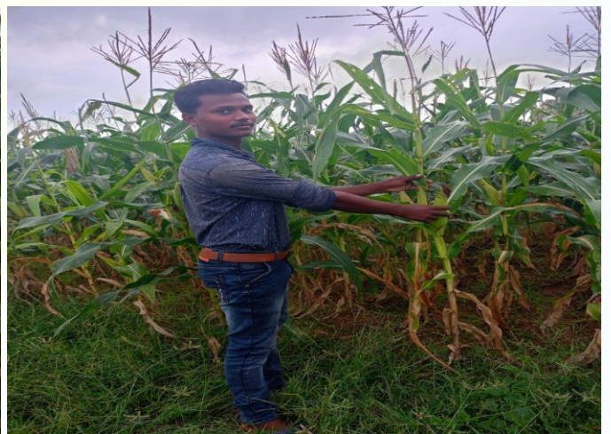
NFSM-Pulse (Intercrop) मक्का प्रत्यक्षण का फोटो, प्रखण्ड - मधुपुर