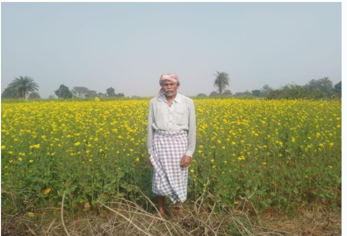
सरसों मिनिकिट प्रत्यक्षण का फोटो, प्रखण्ड- मोहनपुर