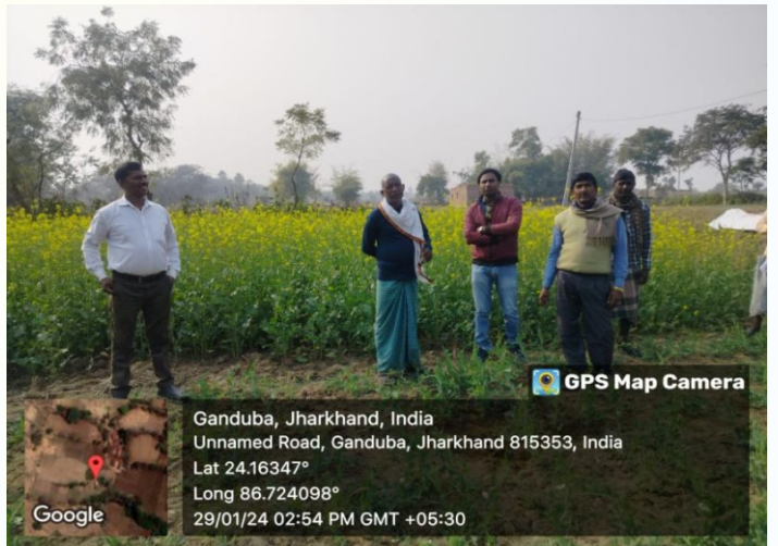
सरसों मिनिकिट प्रत्यक्षण का फोटो, प्रखण्ड - करौं