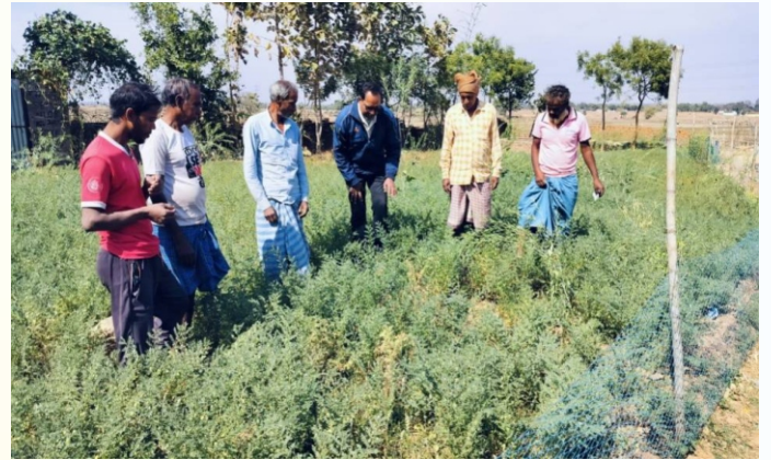
चना प्रत्यक्षण का फोटो, प्रखण्ड- मारगोमुण्डा