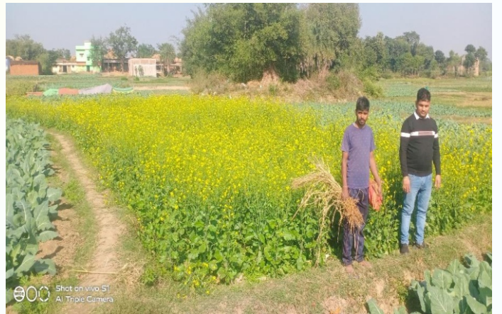
सरसों मिनिकिट प्रत्यक्षण का फोटो, प्रखण्ड- मधुपुर