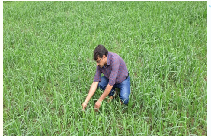
महुवा मिनिकिट प्रत्यक्षण का फोटो, ग्राम + पंचायत - केनमनकाठी, प्रखण्ड - देवघर