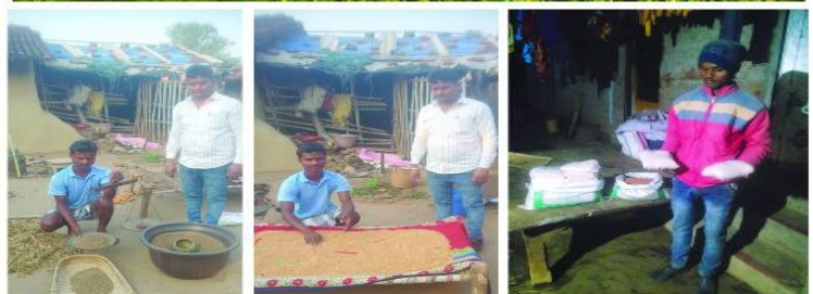
मडुवा मिनिकिट प्रत्यक्षण का फोटो , ग्राम कन्हाईडीह, पंचायत- दार्वे, प्रखण्ड- मधुपुर