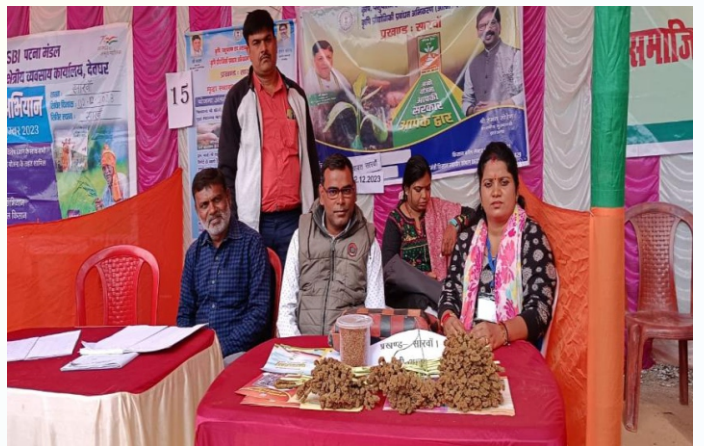
महुवा मिनिकिट प्रत्यक्षण का फोटो , ग्राम - डुमरडिहा, पंचायत - लखौरिया, प्रखण्ड- सारवाँ