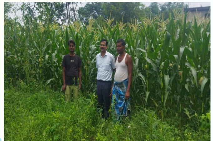
NFSM-Coarse Cereal (Solecrop) मक्का प्रत्यक्षण का फोटो, प्रखण्ड - देवीपुर