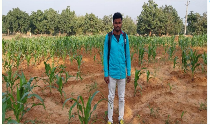
NFSM Coarse Cereal (Solecrop) मक्का प्रत्यक्षण का फोटो, प्रखण्ड - मोहनपुर