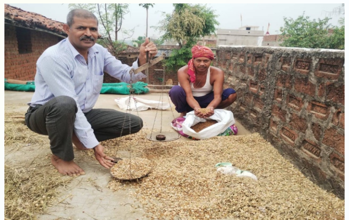
चना प्रत्यक्षण का फोटो, प्रखण्ड - मधुपुर