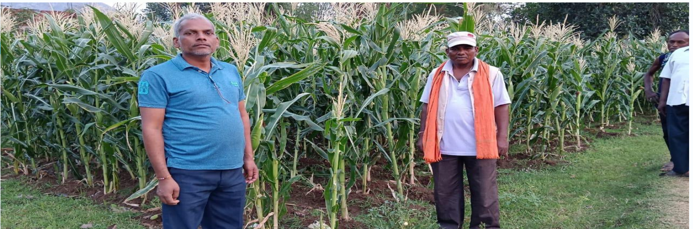
NFSM Goarse Cereal (Solecrop) मक्का प्रत्यक्षण का फोटो, प्रखण्ड - पालोजोरी