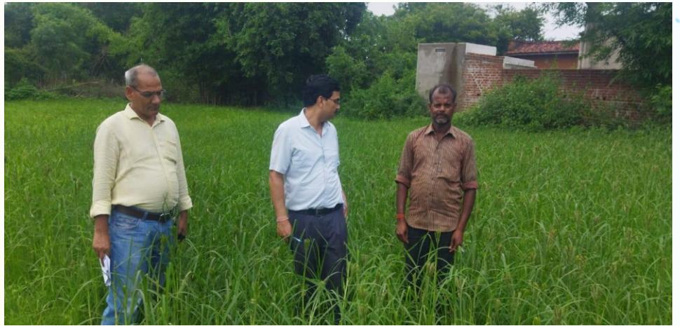
महुवा मिनिकिट प्रत्यक्षण का फोटो, ग्राम - धरमपुर, पंचायत - धोबाना, प्रखण्ड- देवीपुर