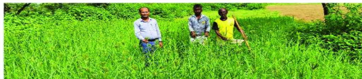
मडुवा मिनिकिट प्रत्यक्षण का फोटे , ग्राम- गोपलारायडीह, पंचायत- केचुवाबांक प्रखण्ड- सारठ