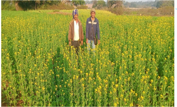
सरसों मिनिकिट प्रत्यक्षण का फोटो, प्रखण्ड- सोनारायवढ़ी