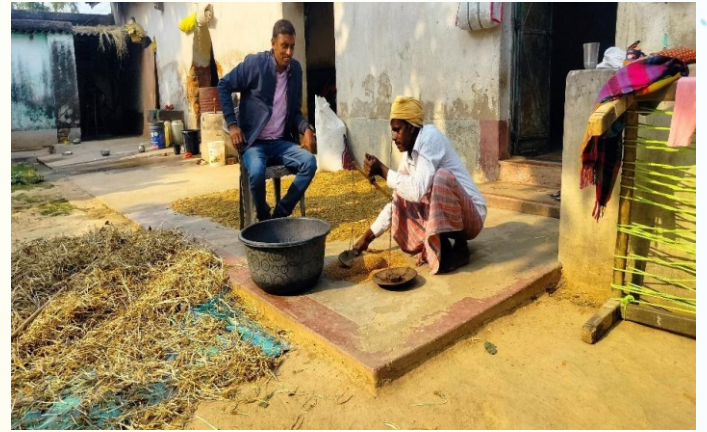
मडुवा मिनिकिट प्रत्यक्षण का फोटे, ग्राम - बेलकियारी, पंचायत - डिण्डाकोली , प्रखण्ड- करौं