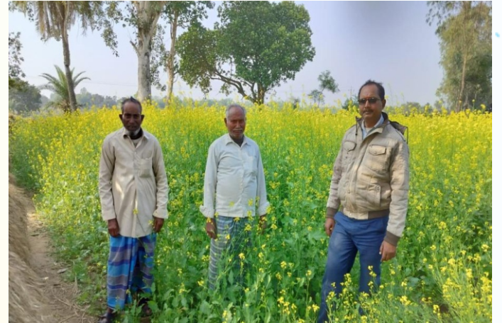
सरसों मिनिकिट प्रत्यक्षण का फोटो, प्रखण्ड- मारगोमुण्डा