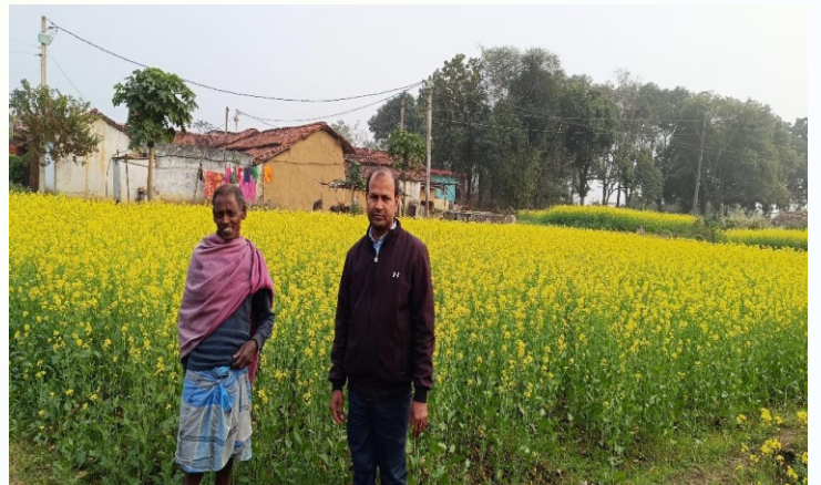
सरसों मिनिकिट प्रत्यक्षण का फोटो, प्रखण्ड- सारठ