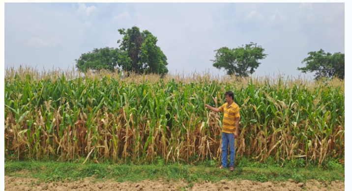
NFSM-Coarse Cereal (Solecrop)मक्का प्रत्यक्षण का फोटो, प्रखण्ड - देवघर