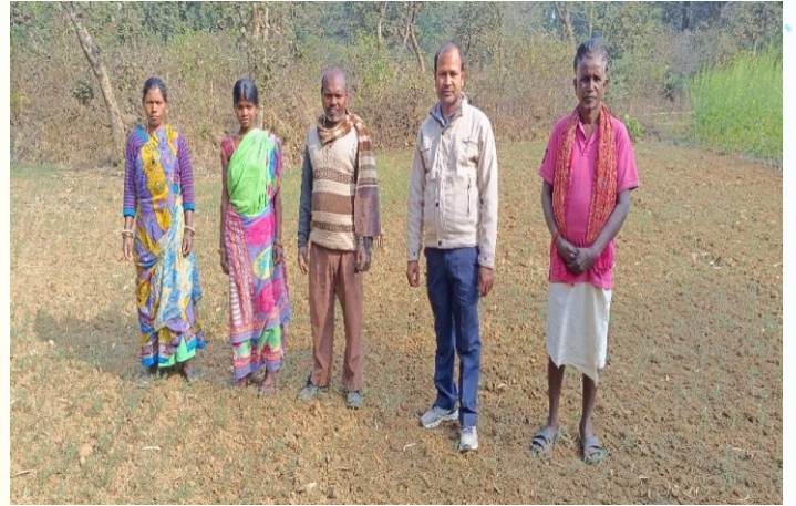
मसूर प्रत्यक्षण का फोटो, प्रखण्ड - सारठ