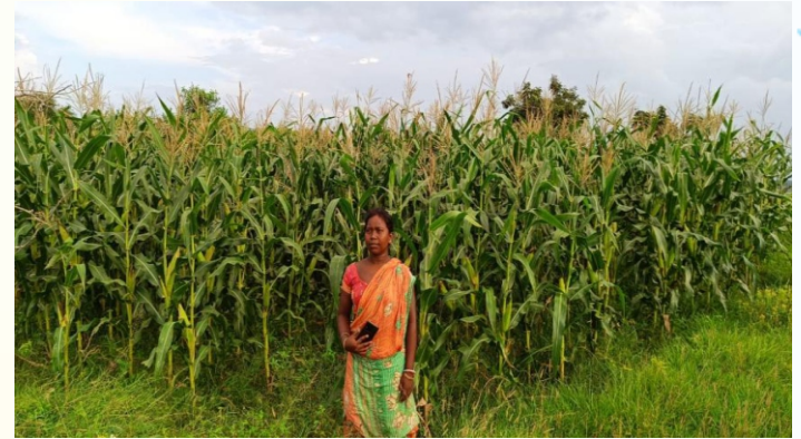
NFSM-Coarse Cereal (Solecrop) मक्का प्रत्यक्षण का फोटो, प्रखण्ड - साठ