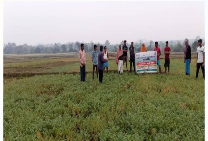
प्रक्षेत्र दिवस, प्रखण्ड- देवीपुर