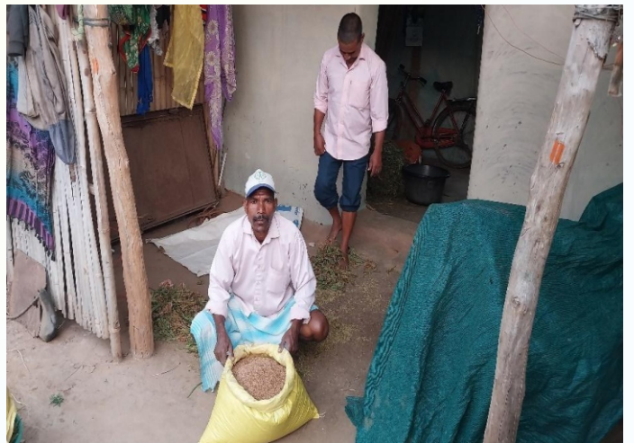
महुवा मिनिकिट प्रत्यक्षण का फोटो , ग्राम - लुटियातरी, पंचायत - ताराबाद, प्रखण्ड- मोहनपुर