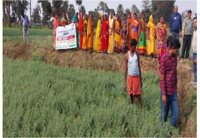
प्रक्षेत्र दिवस, प्रखण्ड- मोहनपुर