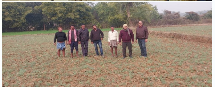
चना प्रत्यक्षण का फोटो, प्रखण्ड - मोहनपुर