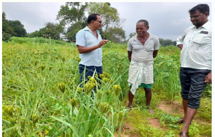
मडुवा मिनिकिट प्रत्यक्षण का फोटे , ग्राम + पंचायत - बाघमारा , प्रखण्ड- मारगोमुण्डा