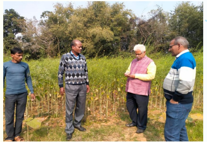
सरसों मिनिकिट प्रत्यक्षण का फोटो, प्रखण्ड- देवघर