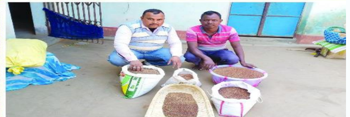
मडुवा मिनिकिट प्रत्यक्षण का फोटो , ग्राम+पंचायत - सगराजोर, प्रखण्ड- पालोजोरी